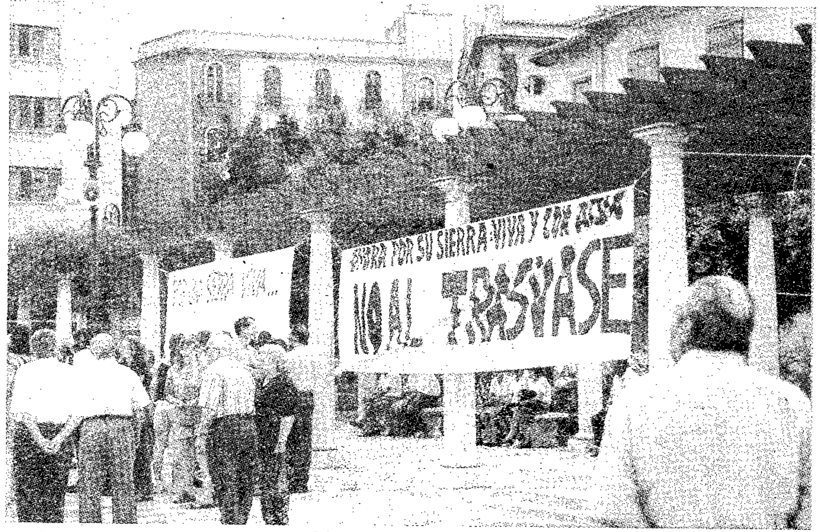
Manifestación en Alzira

Este trasvase, que tanto tiempo nos ha ocupado en los dos últimos años, ya tiene empresas adjudicatarias para la construcción de su primer tramo, la elevación de Cortes de Pallás. Para los tramos de nuestra Sierra del Caroche se abre un nuevo plazo de espera que no nos dejará con los brazos cruzados. Quizá sea necesario insistir en que no sólo estamos hablando de un trasvase de agua, sino también de un trasvase de riqueza; la de nuestros paisajes y naturaleza que sería gravemente afectada y que por tanto constituye una intolerable pérdida mientras que existe una riqueza que es la que el agua generaría, precisamente, en las comarcas que ya gozan de un mayor nivel de renta en la Comunidad. Recordemos que se trata de la franja turística del litoral alicantino. La burla al más mínimo