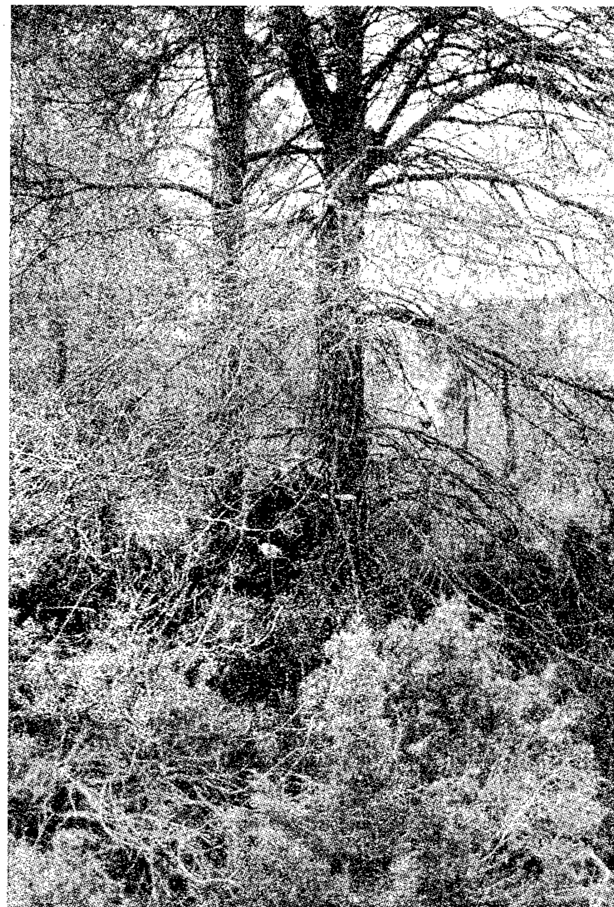
Junta de Adene

Desde Adene queremos agradecer la colaboración del dueño de la casas de Reig y esperamos poder seguir colaborando en estas actividades con otros propietarios de nuestra Sierra.