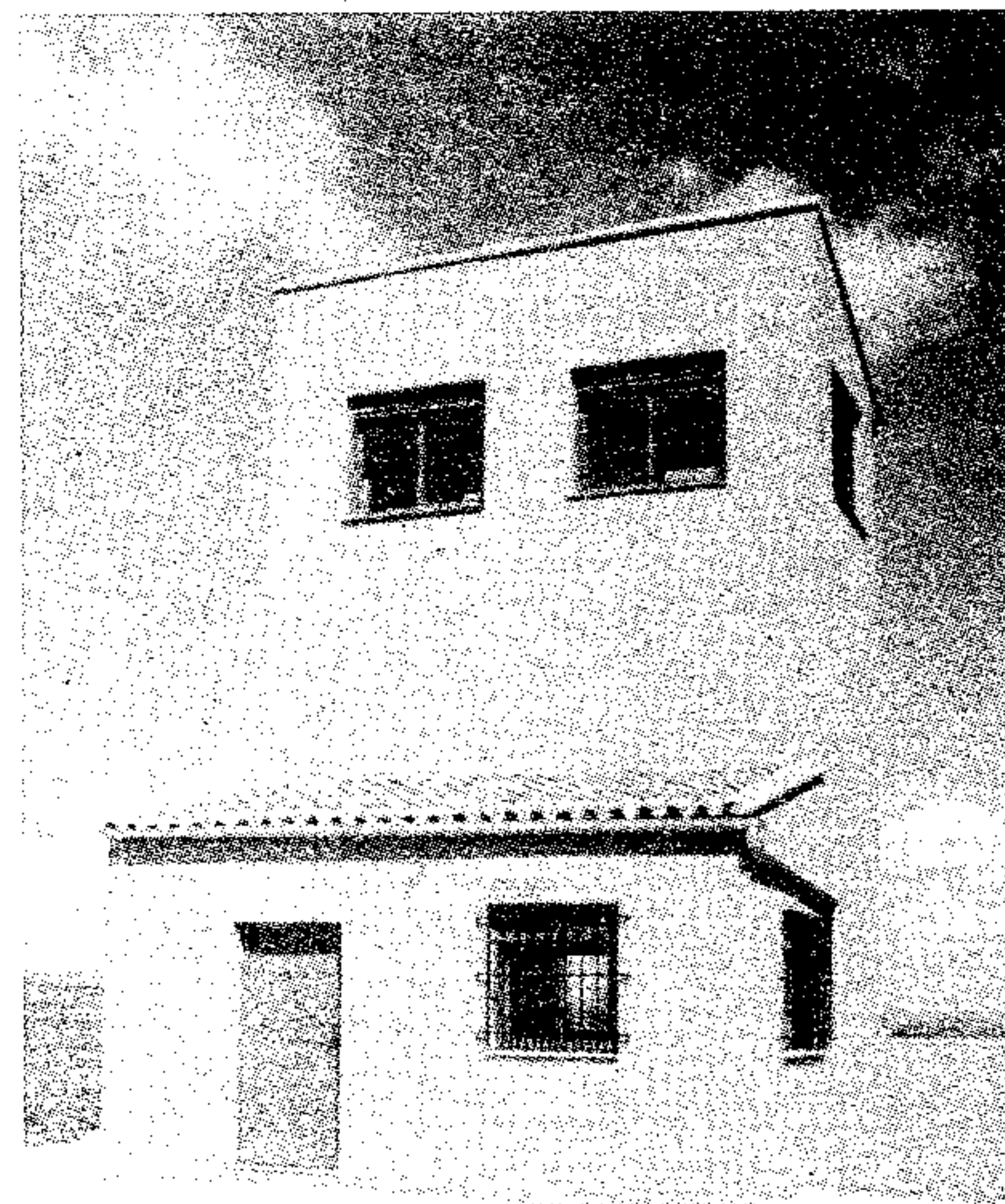
Torreta de Vigilancia

Desde Adene queremos agradecer a todas aquellas personas que han demostrado un comportamiento ejemplar en nuestra Sierra y que han disfrutado de unos días rodeados de la naturaleza. ■