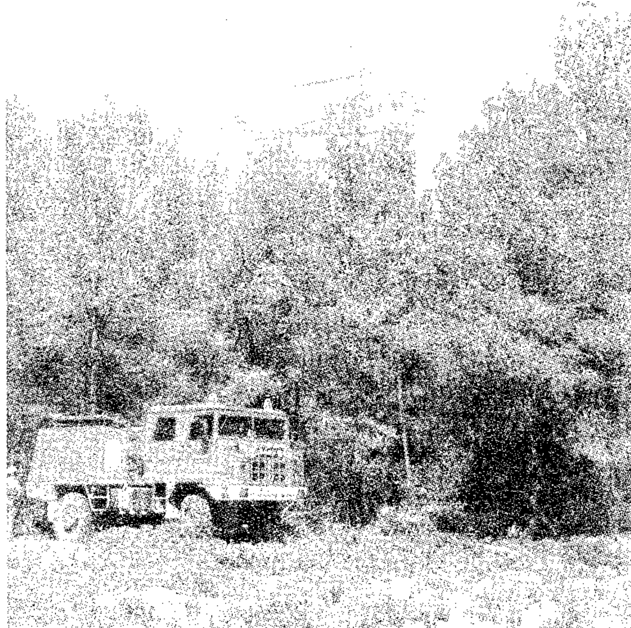
Medios aéreos y terrestres

Adene logró el tercer premio dotado con 1.503 euros. Este premio se suma ya, entre otros, al premio Cavanilles, que el centro excursionista de Valencia otorgó a Adene el año pasado. Adene presentó al concurso de Mafre un completo estudio y descripción de las balsas ubicadas en la sierra de Enguera, acompañados de planos, mapas, fotografías y otros documentos. El objetivo de este estudio era el de localizar todos los potenciales puntos de agua situados en la sierra de Enguera para poderlos utilizar en caso de emergencias forestales. El proyecto, sin embargo no se limita a una mera descripción sino que se seleccionaban otras balsas que se utilizaban como depósitos de riego y que rehabilitándolas, podrían volver a utilizarse, permitiendo de nuevo el cultivo en campos que en la actualidad son eriales, y se marcaban la necesidad de construcción de nuevas balsas para tener cubierta con garantías toda la superficie forestal de Enguera. El estudio identificaba accesos, denominaciones,