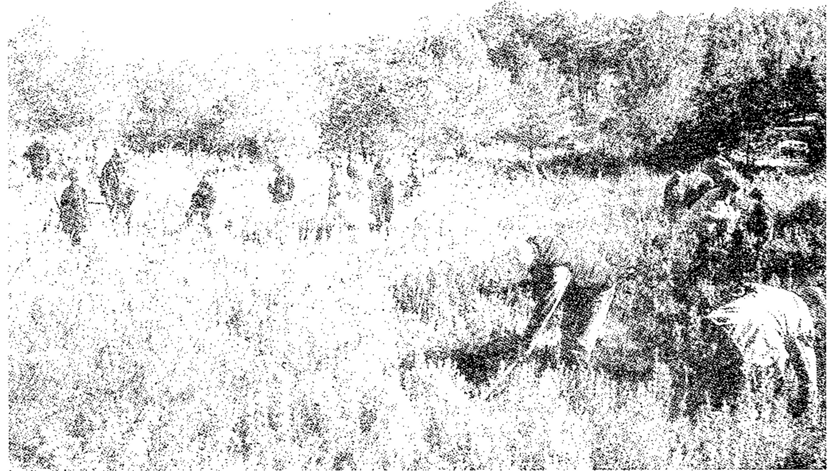
Participantes en el Día del Arbol

A continuación se le celebró la tradicional comida de hermandad entre