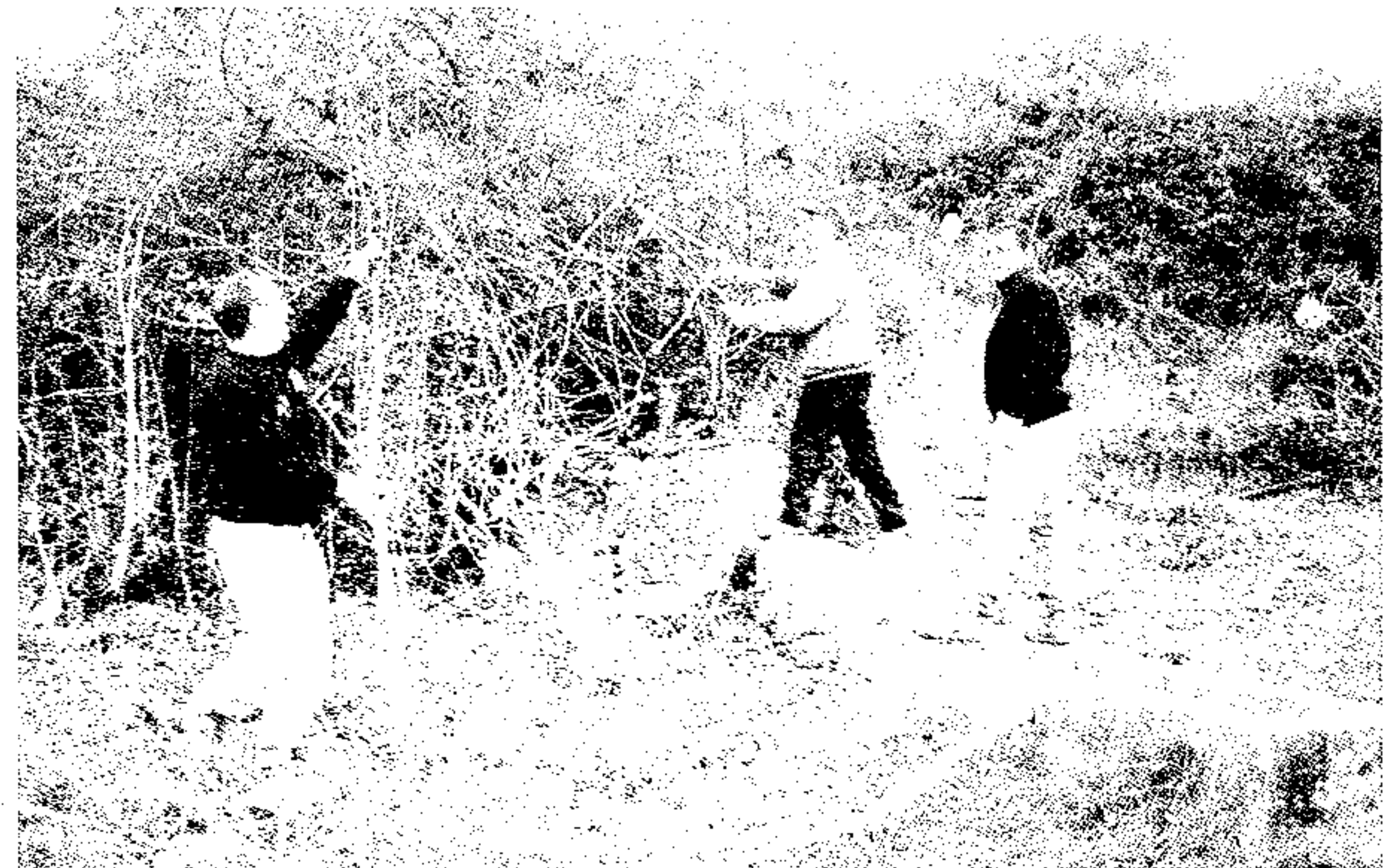
Pozo de Benamil