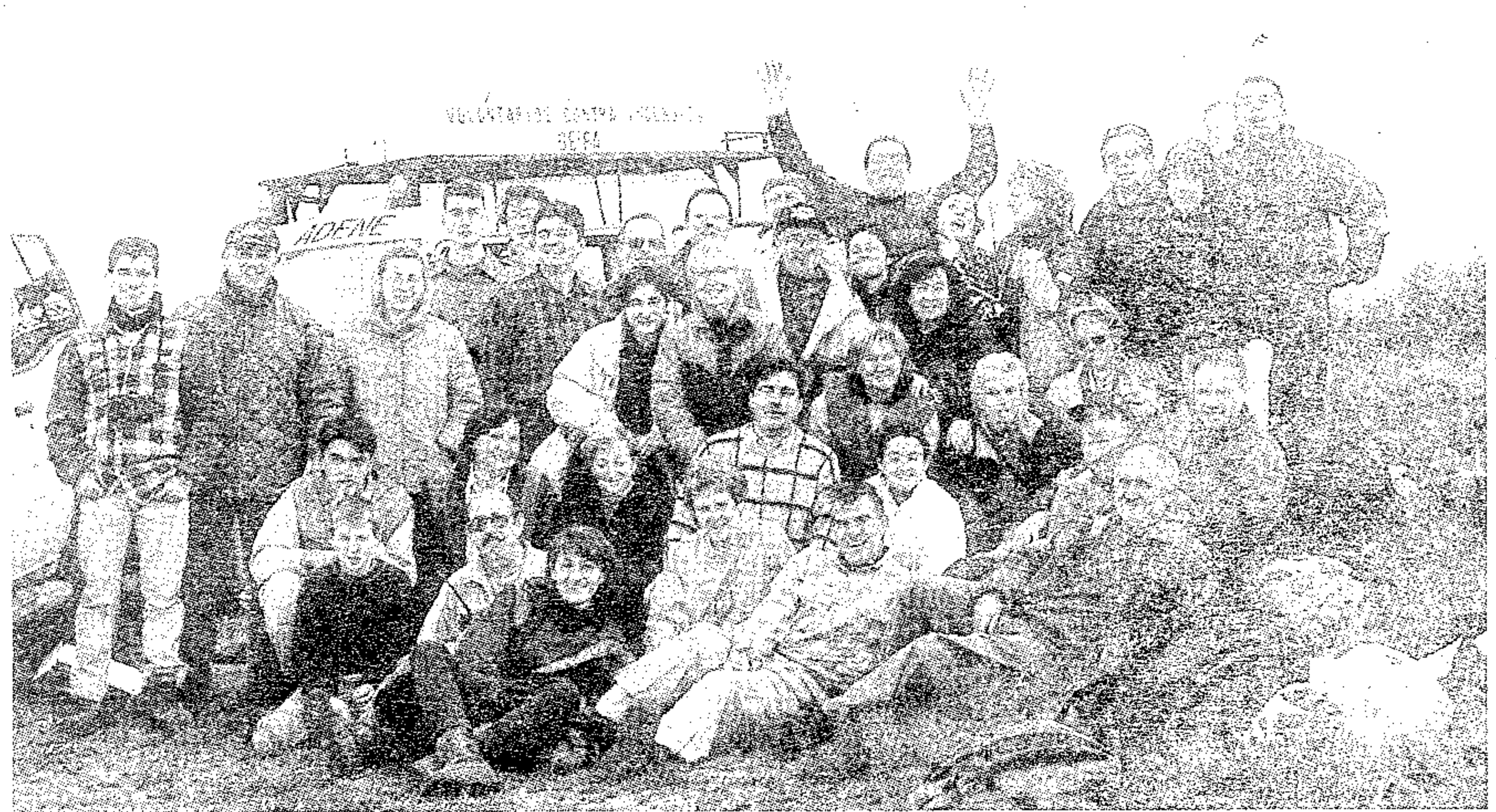
Grupo de Adene y el Centro Excursionista en la zona del Tintorero