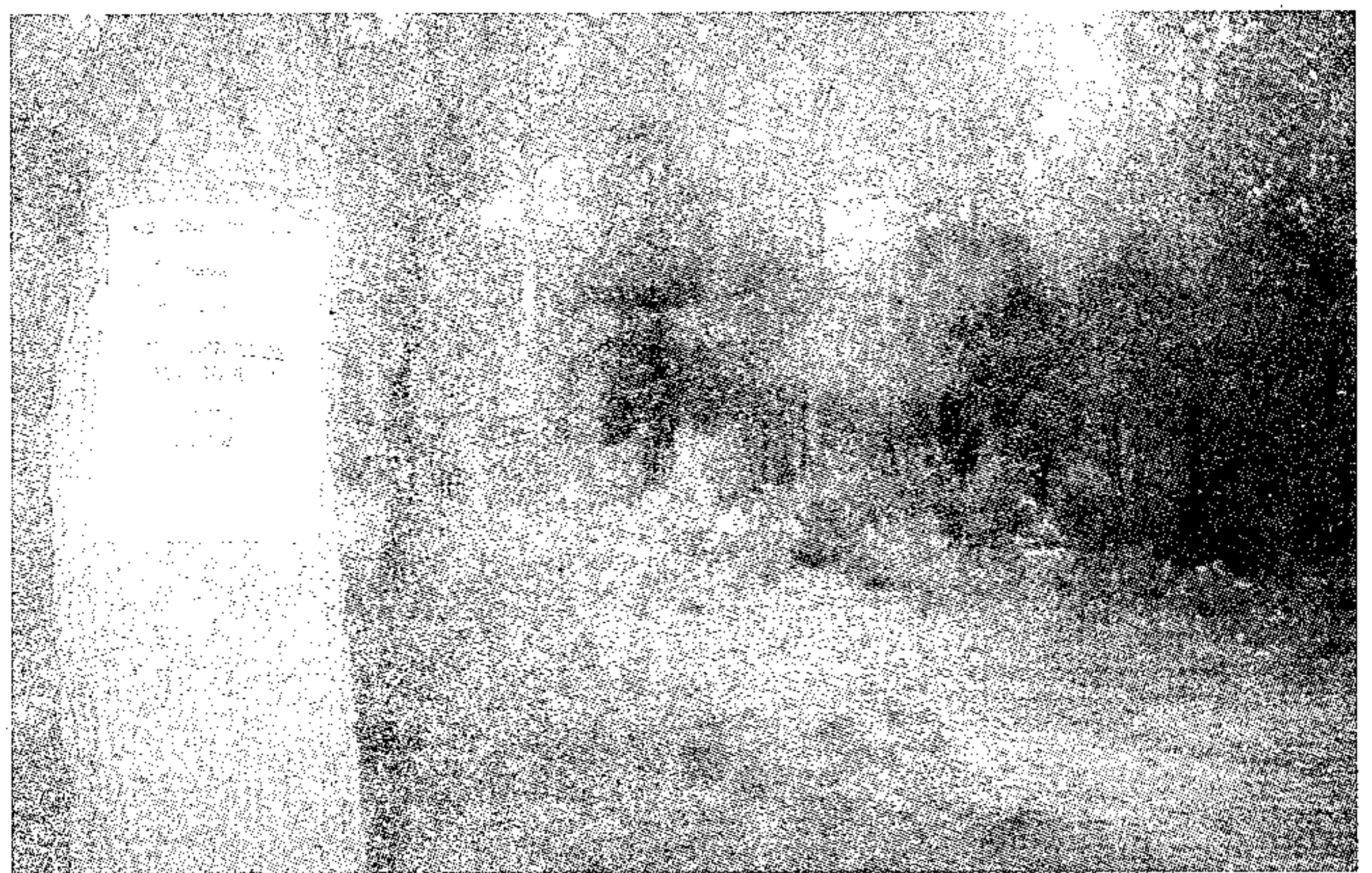
Así se quedó el monte tras la limpieza de la basura.

En total se recogieron 80 bolsas de basura, 65 botellas de vidrio, neumáticos, 3 lavadoras y otros materiales de hierro. Para ello se contó con dos vehículos con remolque y la participación de voluntarios de ADENE.