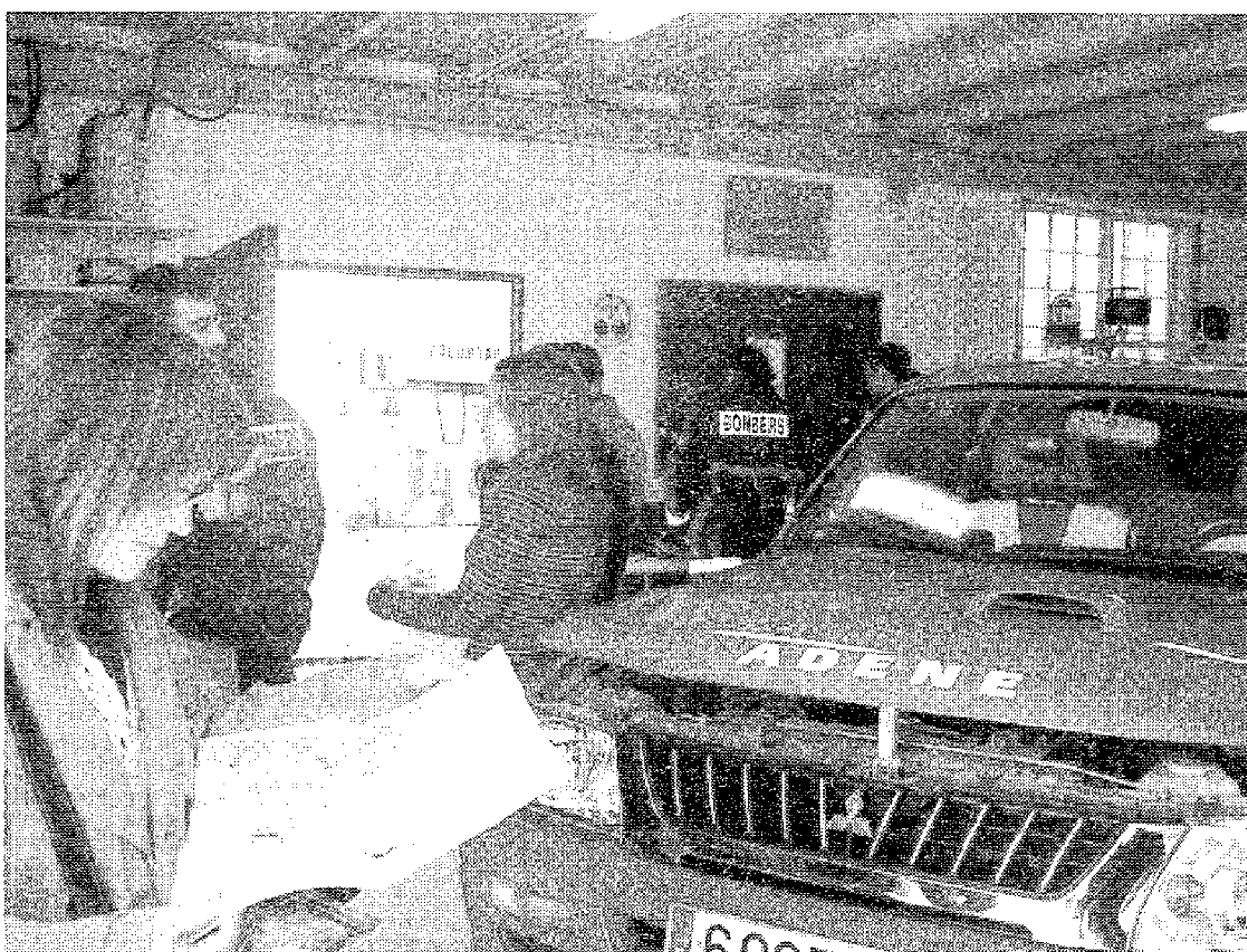
Parque de voluntarios

El pasado 31 de marzo se inauguró el Parque de Voluntarios de Adene, contra incendios forestales, el cual consta de una planta baja de 80 metros cuadrados donde están situados los dos pick-up, equipados con sus respectivas mangueras, batefuegos, azadas, motobomba de aspiración, etc. así como los EPI (Equipos de Primera Intervención).