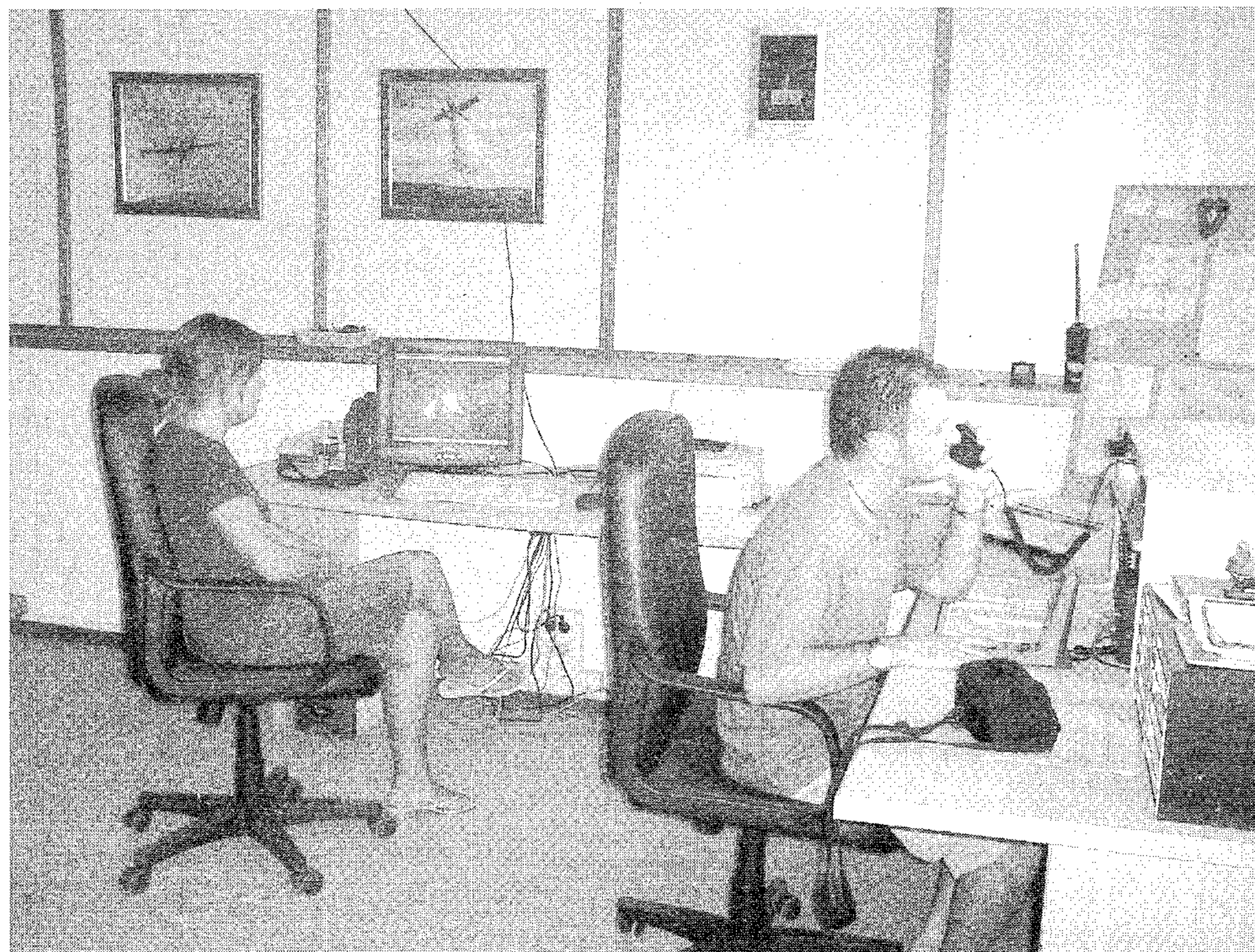
Centro de Emergencias - Sede de Adene

El Grupo de Vigilancia Forestal de ADENE terminó el pasado 15 de Septiembre la Campaña de este año, con la participación de 48 socios y simpatizantes y el seguimiento y control por dos Coordinadores, utilizando el vehículo Nissan todo-terreno y los dos vehículos dotados de motobomba para cubrir todo nuestro territorio y mejorar su labor.