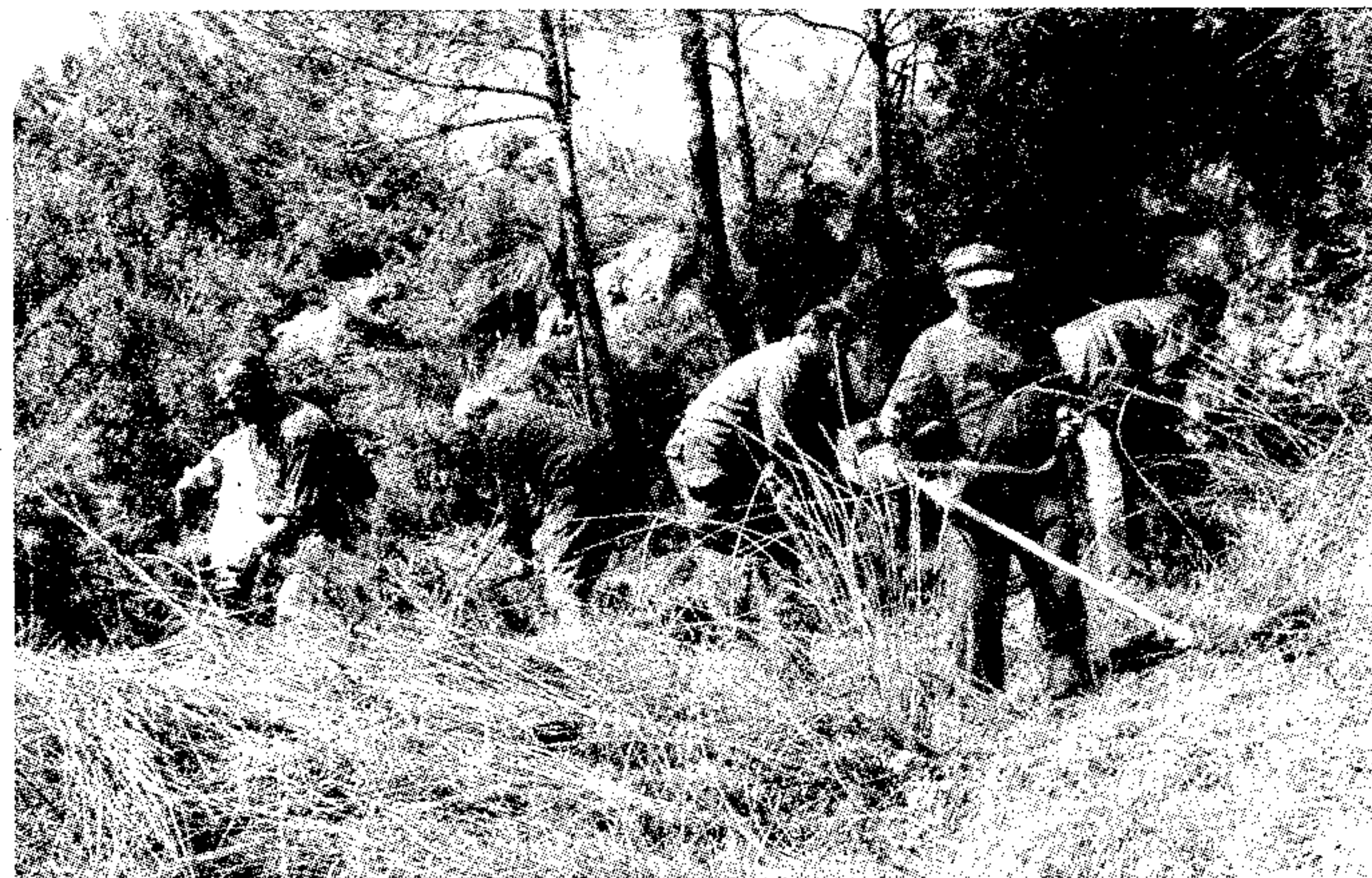
Limpieza Fuente Los Balsaretos

Para acceder al mismo se debe coger la Carretera Local que une Enguera con el Caserío de Benalí, al llegar al Km. 16,800. Nos aparece a nuestra izquierda la pista forestal que nos llevara al sendero, la dirección que tenemos que seguir es recto hasta que llegamos a un cruce donde nos aparecerá un cartel que nos indica La Cornicabra, donde dejaremos el vehículo. El Sendero hay que realizarlo a pié y en forma circular. ■