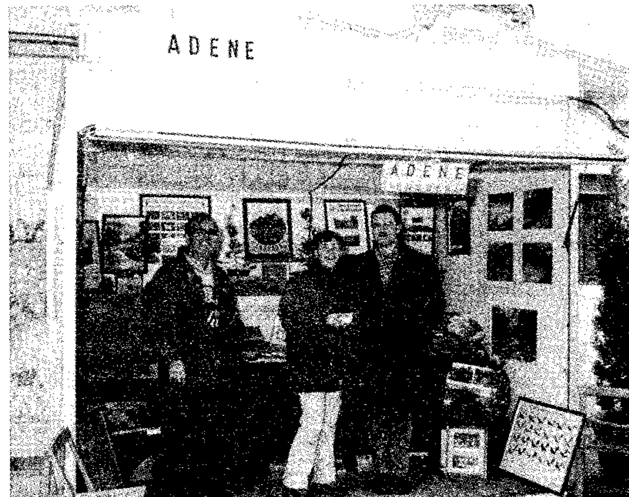
Stand de Adene en Quesa

Es de destacar que el transporte del material, montaje, decoración, instalación, atención de los dos stands, promoción de productos, información, etc., ha sido desarrollado íntegramente por los voluntarios de ADENE, y la experiencia ha sido tan positiva que se ha hecho un proyecto, con la subvención ya aprobada para la construcción de una caseta portátil para que nuestra Asociación pueda asistir a otras ferias y certámenes, tanto para el cumplimiento de nuestros fines, como en colaboración con otras Entidades, pudiendo servirnos de apoyo en una futura autofinanciación. ■