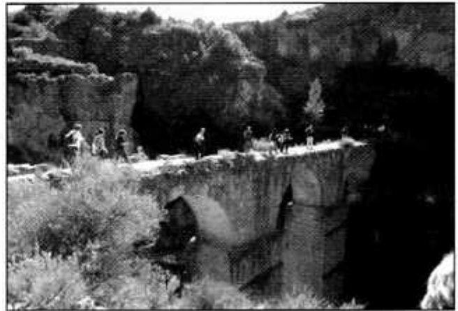
Peña cortada (Calles)

-A principios de mayo, en un día que amaneció con una inesperada lluvia, realizamos la mitica marcha al Caroché, en esta no solo pusimos a prueba el cuerpo sino la mente, ya que aunque sabes que con cada paso que das te vas acercando al Caroché, este, parece inalcanzable. Cuando por fin llegas al pico te das cuenta, de que el esfuerzo ha valido la pena, a pesar de que algunos habíamos jurado no volver nunca jamás. Y sin duda lo mejor de cada marcha, la gente. Nos vemos en la próxima.