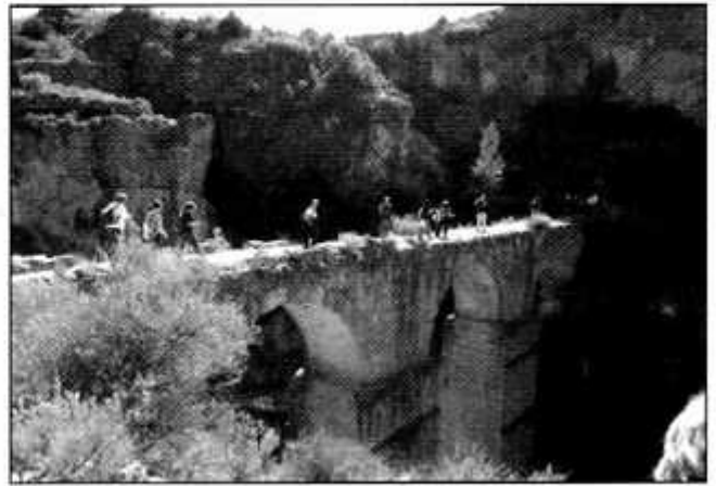
Peña cortada (Calles)

-A principios de mayo, en un día que amaneció con una inesperada lluvia, realizamos la mitica marcha al Caroché, en esta no solo pusimos a prueba el cuerpo sino la mente, ya que aunque sabes que con cada paso que das te vas acercando al Caroché, este, parece inalcanzable. Cuando por fin llegas al pico te das cuenta, de que el esfuerzo ha valido la pena, a pesar de que algunos habíamos jurado no volver nunca jamás. Y sin duda lo mejor de cada marcha, la gente. Nos vemos en la próxima.