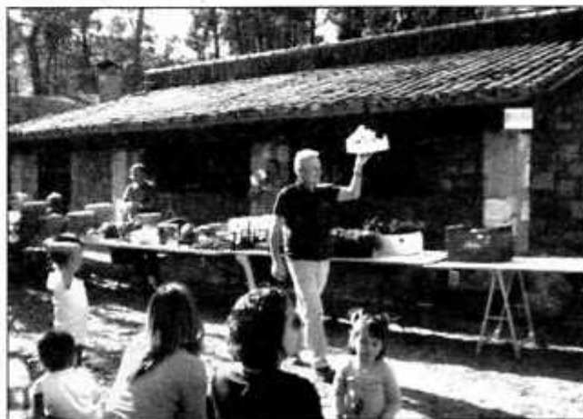
La Junta Directiva.