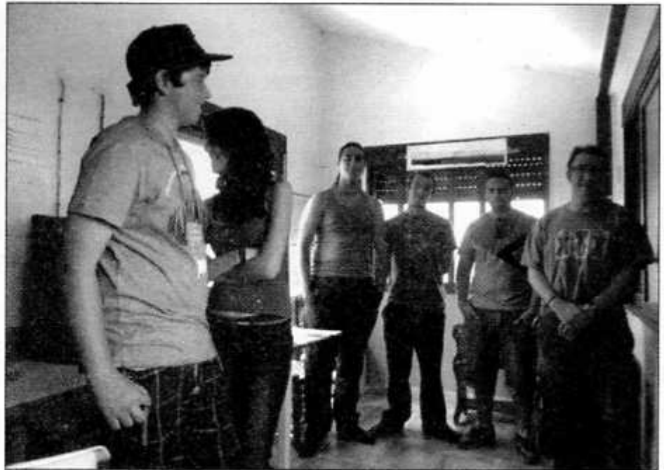
Grupo de voluntarios visitando la torre

La conservación y potenciación del medio natural de Enguera figura entre los fines estatutarios de nuestra asociación y para ello se han realizado durante mucho tiempo vigilancias forestales para prevención de incendios forestales tanto en la torre de vigilancia "Manolo Puchades" como con el vehículo. En los momentos actuales, donde las ayudas económicas por parte de la administración para estos fines se reducen a lo anecdótico, hay que ser imaginativos y flexibles para seguir realizando esta actividad. Por ello hemos querido ampliar la labor de vigilancia a todo aquel que de forma voluntaria y altruista quiera dedicar su tiempo libre a este menester, para la mejora de la calidad de vida de otras personas, para mantener aquello que es imprescindible para la vida.