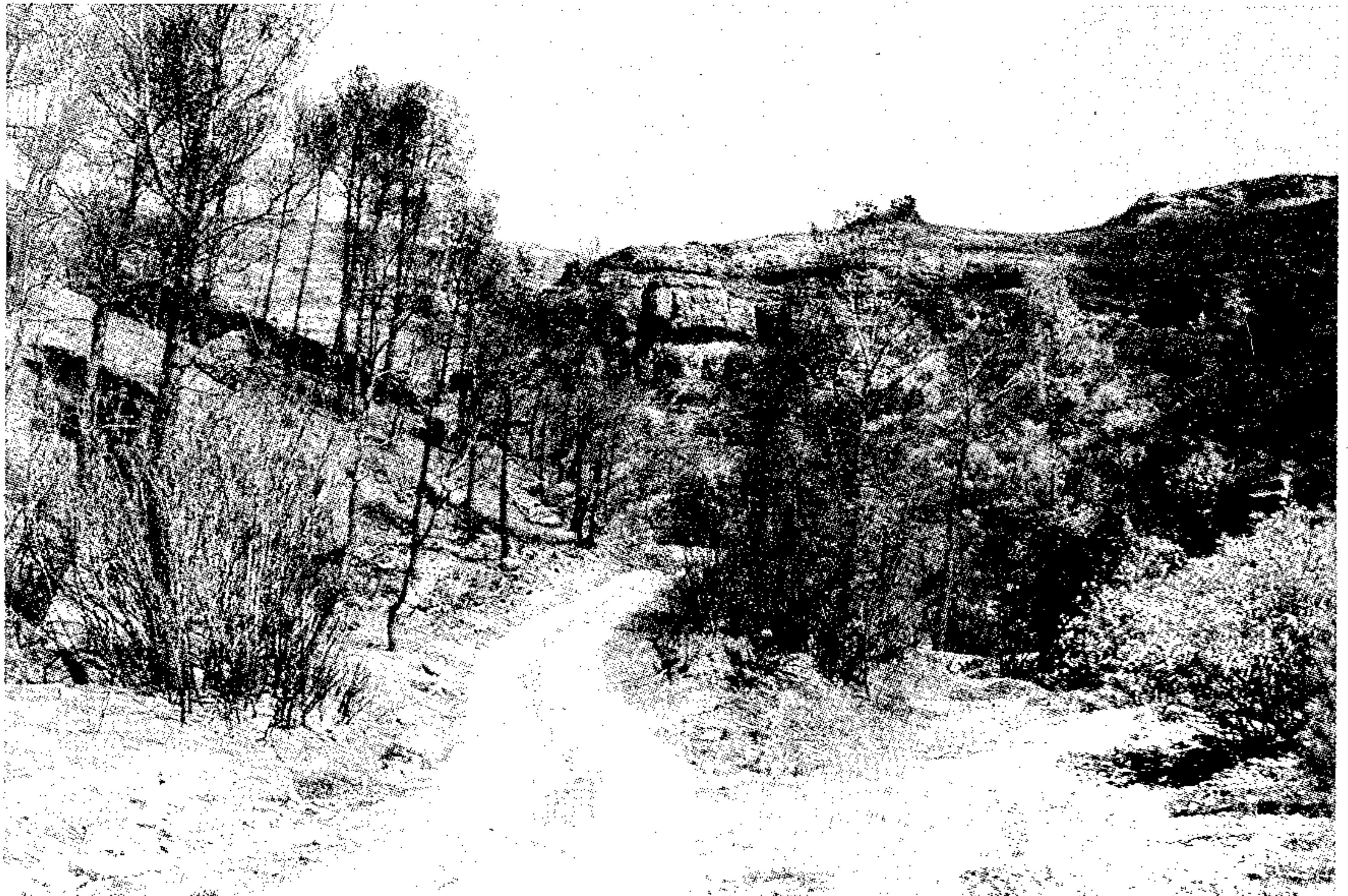
Lecho del Barranco de la Hoz

Al amanecer del día 16 de Agosto los medios aéreos empiezan a sobrevolar el incendio descargando agua sobre los focos activos que aun permanecían sin extinguir. A media mañana el incendio se controlaba. Las brigadas empiezan a repasar el perímetro del incendio mientras los medios aéreos no paran de lanzar agua a los rescoldos que aun quedan activos ya que es una zona muy abrupta y de difícil acceso para los medios terrestres.