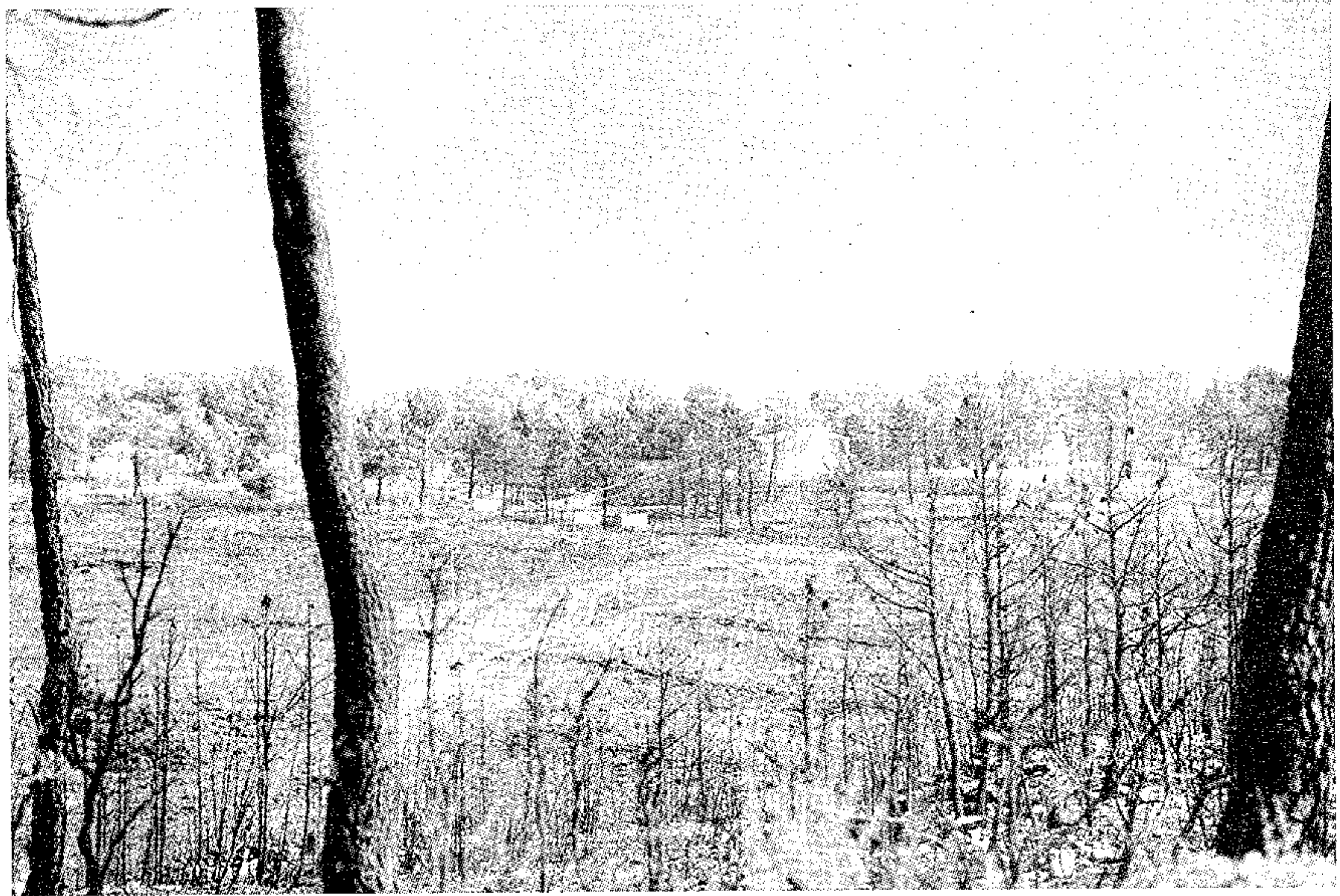
Zona del transformador

Al margen del listado, que a continuación figura, queremos resaltar la colaboración de grupos de Jóvenes que se pusieron a disposición de esta entidad y del Ayuntamiento para efectuar varias tareas.