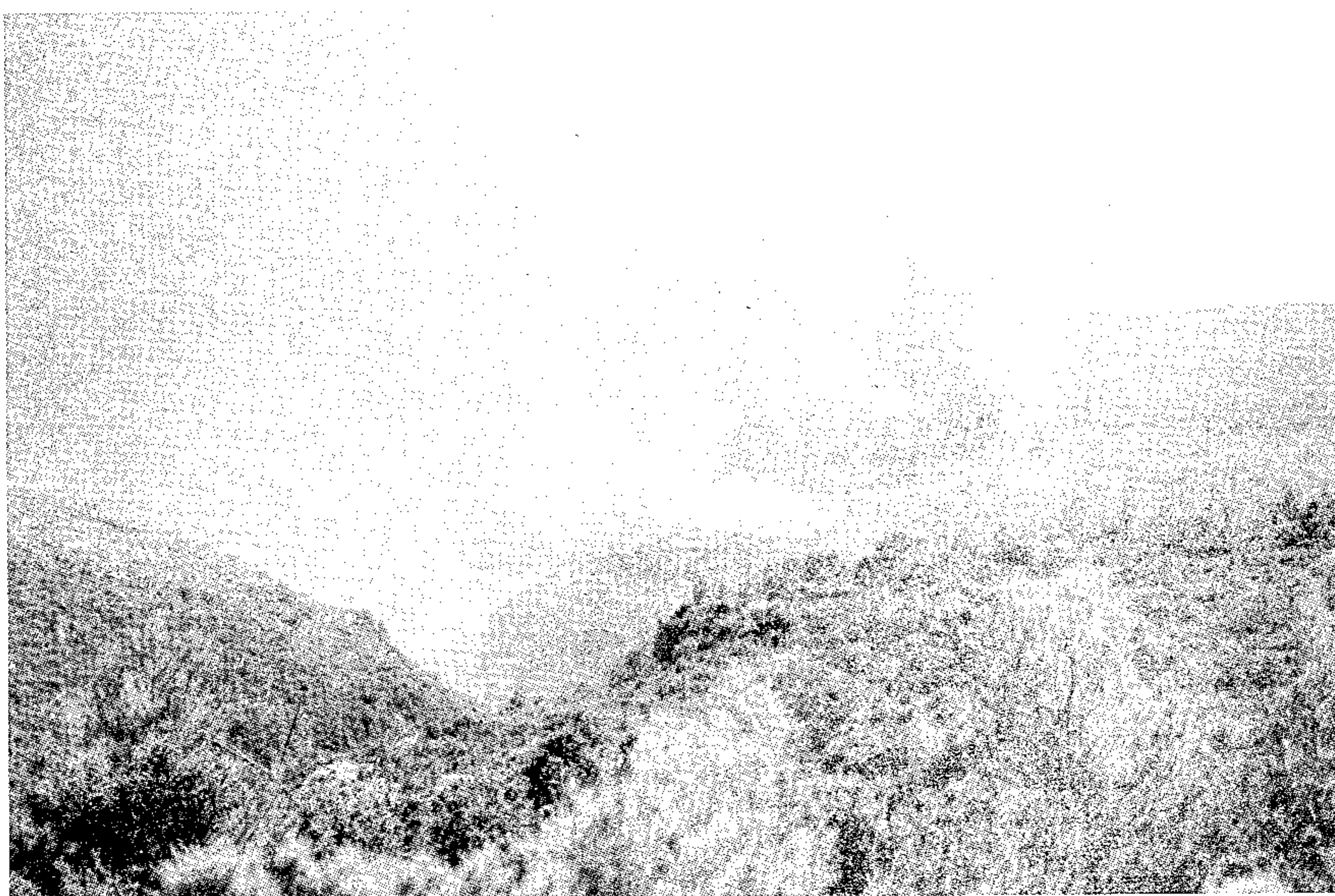
Fotografía efectuada desde Vistahermosa

Después de varios años en que la Sierra de Enguera no acogía ningún incendio forestal de tan grandes magnitudes, el fantasma del fuego vuelve a asolar nuestra sierra.