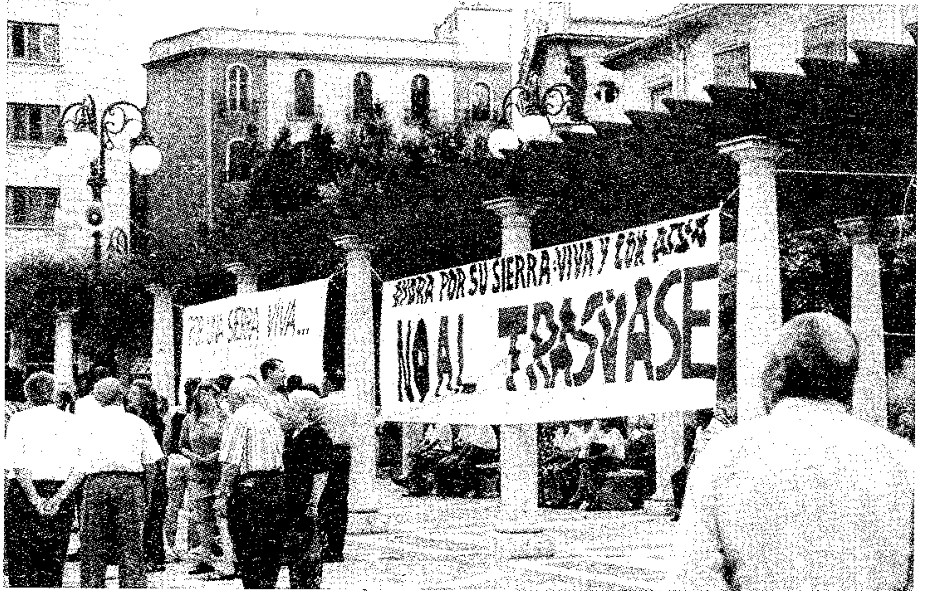
Manifestantes en la concentración

En esta comarca no podíamos esperar otra cosa, acostumbrados a sufrir el, empecinamiento de determinados señores «interesados» en la construcción del Trasvase Júcar-Vinalopó. ■