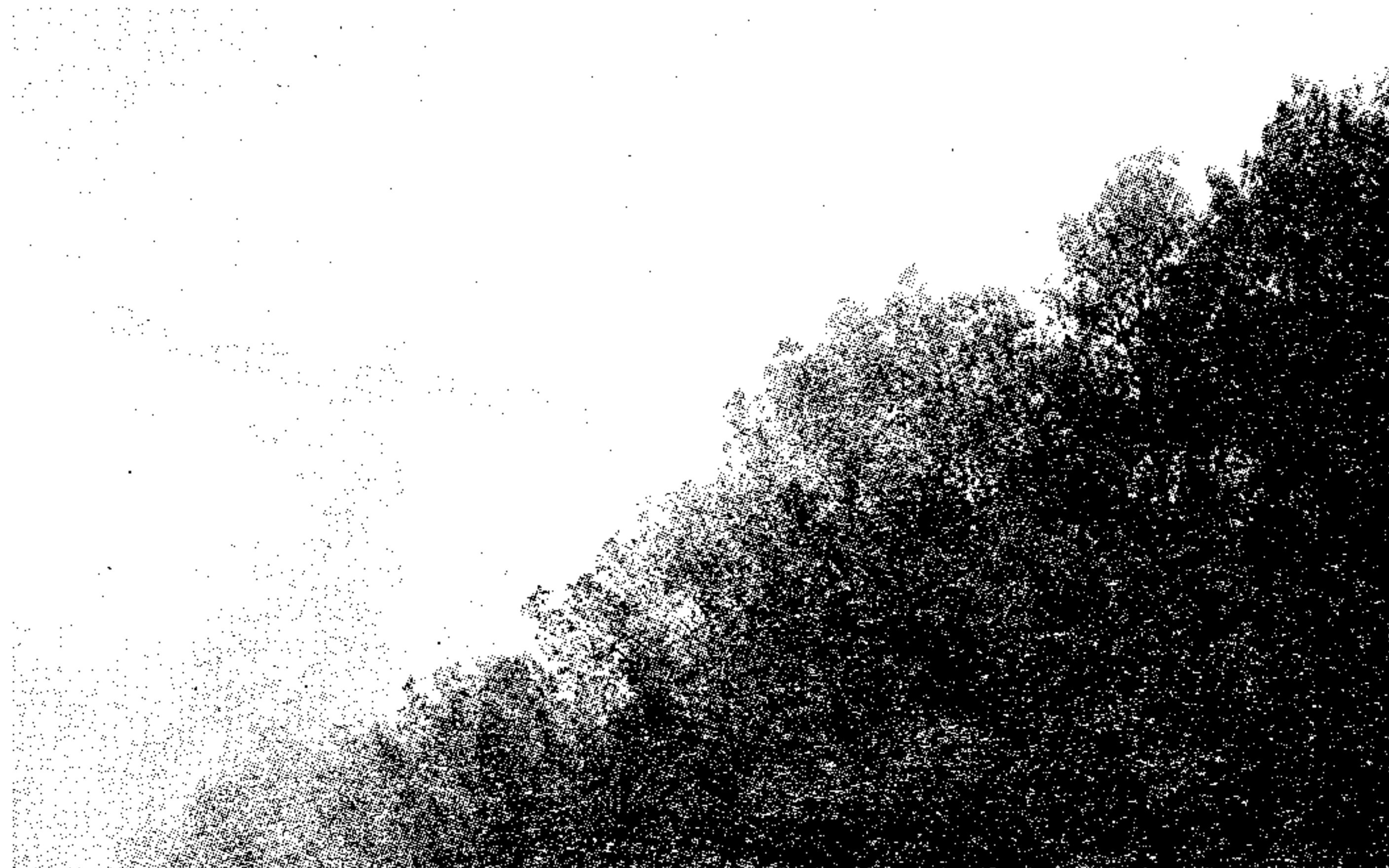
Air-Tractor haciendo una descarga

Esta vez el incendio se había producido en la Zona de la Matea, por las condiciones climatológicas y las características del terreno el fuego se extendía, con rapidez hacia el barranco de los Menores, próximo al Puntal. Inmediatamente nos dirigimos hacia la zona para colaborar en las tareas de extinción del incendio, a medida que nos íbamos acercando veíamos que el humo iba disminuyendo, cosa que nos tranquilizó y cuando llegamos, afortunadamente el incendio ya estaba casi controlado, se habían desplazado hasta allí medios de extinción aéreos y terrestres, que actuaron con gran rapidez, así como voluntarios de Enguera y Ayora. En esta ocasión los medios de extinción pudieron contar con el agua de la balsa de la Matea, que estaba en óptimas condiciones, tras las constantes peticiones a la Consellería de Medio ambiente para que la llenara.