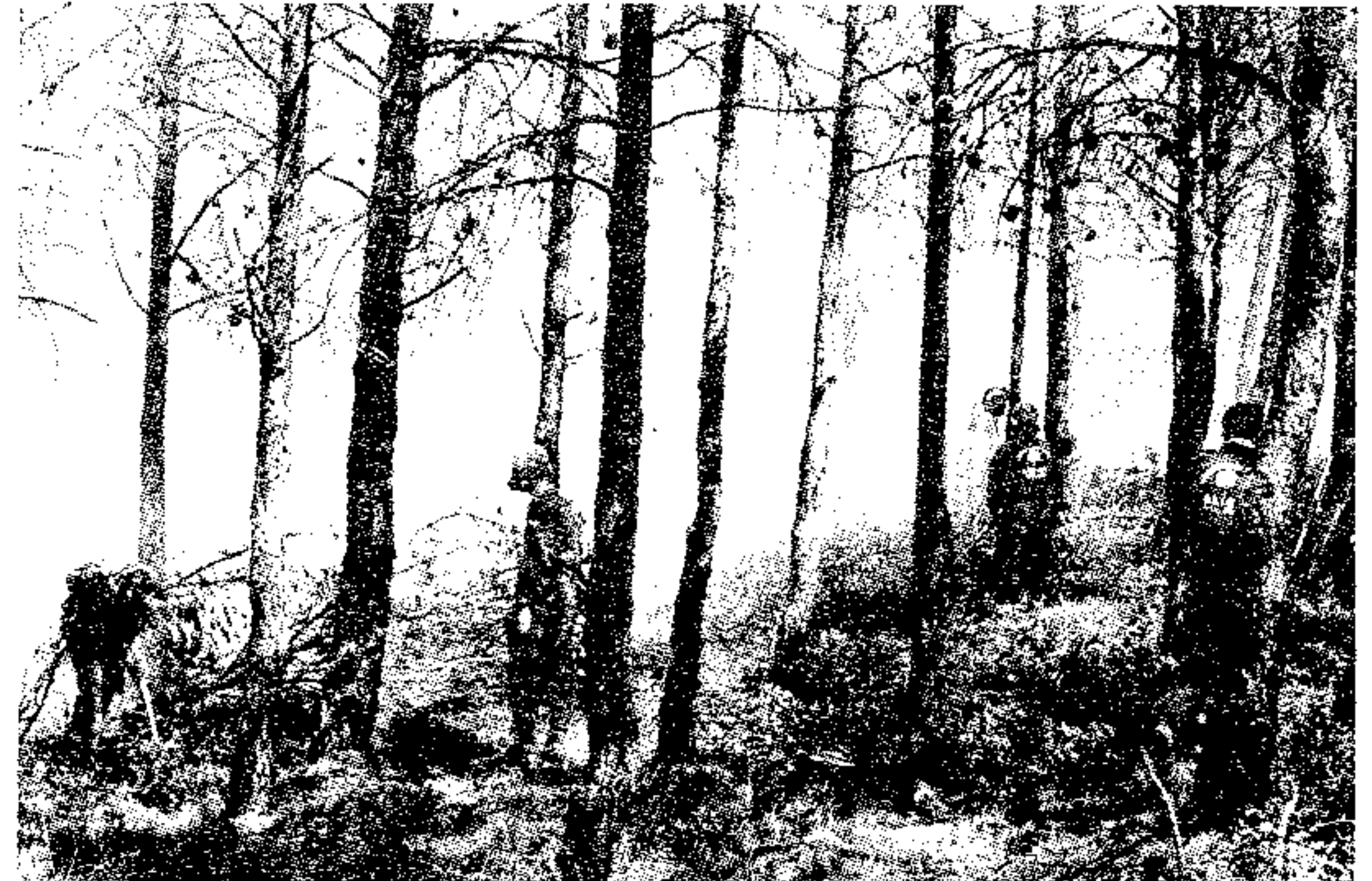
Voluntarios de Adene en el Incendio de Lucena

El Día 24 de Marzo sobre las 11,00 h., apareció de nuevo la lacra de los incendios en la sierra de Enguera. En esta ocasión el peligro surgió en las inmediaciones de la partida de Lucena y debido a circunstancias tanto climatológicas como de situación del monte, este se extendió con rapidez hacia el Mojón Blanco, ardiendo en 3 horas alrededor de 25 has. la mayoría de monte bajo.