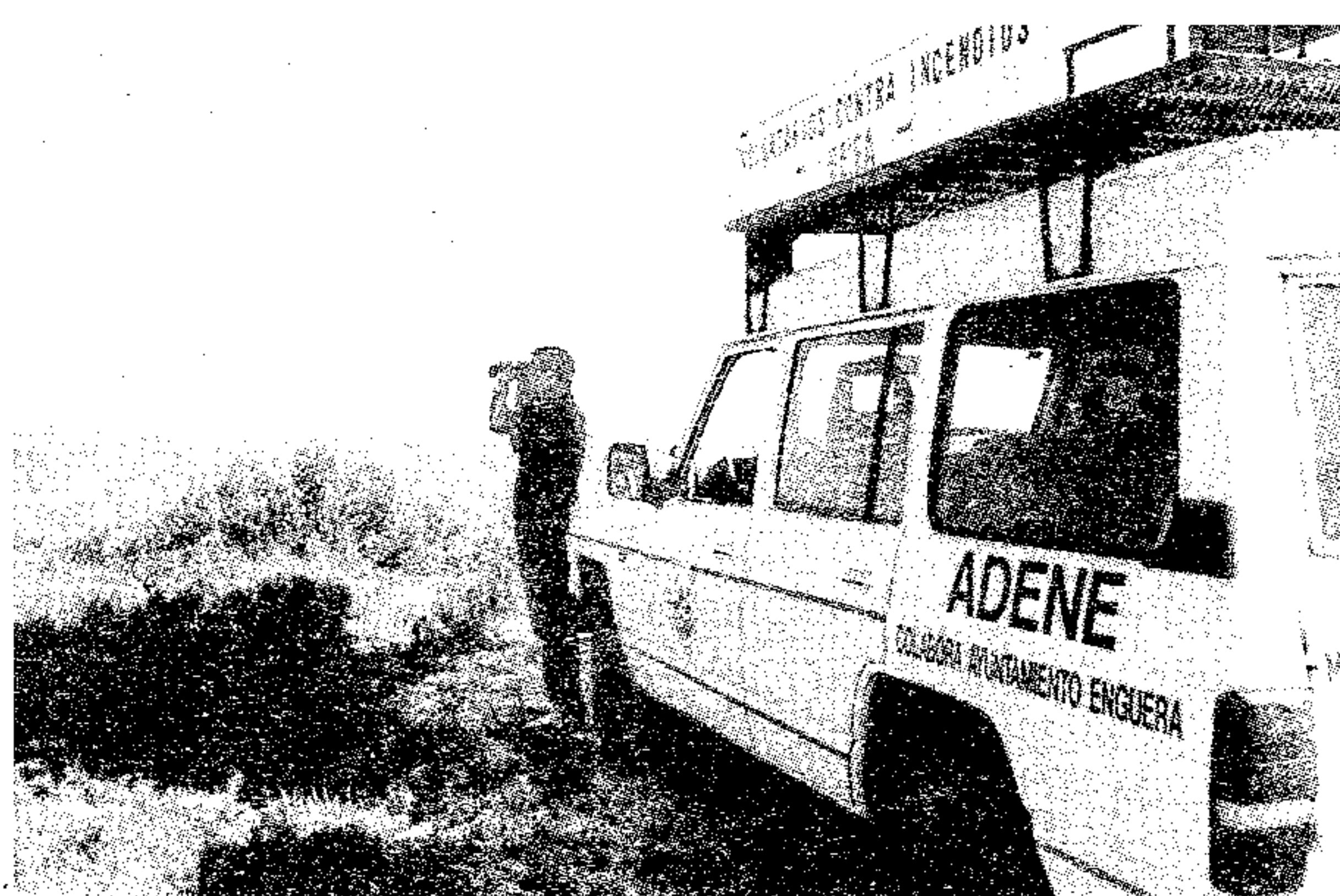
Voluntario en las vigilancias

La Asociación para la Defensa de la Naturaleza de Enguera, Adene, por octavo año consecutivo puso en marcha, el pasado día 2 de junio y hasta el 15 de octubre, el dispositivo de vigilancia de montes, dentro del proyecto del voluntariado medioambiental, subvencionado por la Consellería de Medio Ambiente.