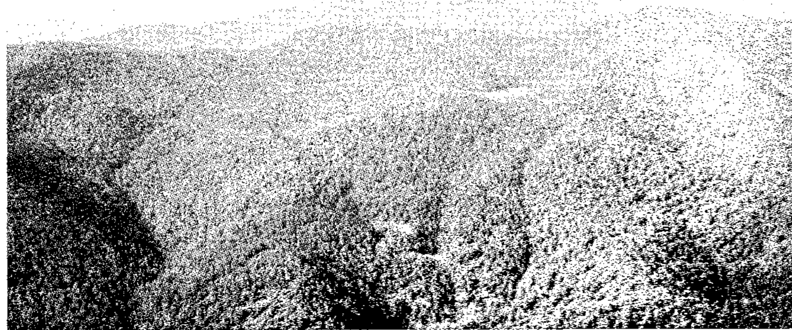
Vista General del Macizo del Caroig