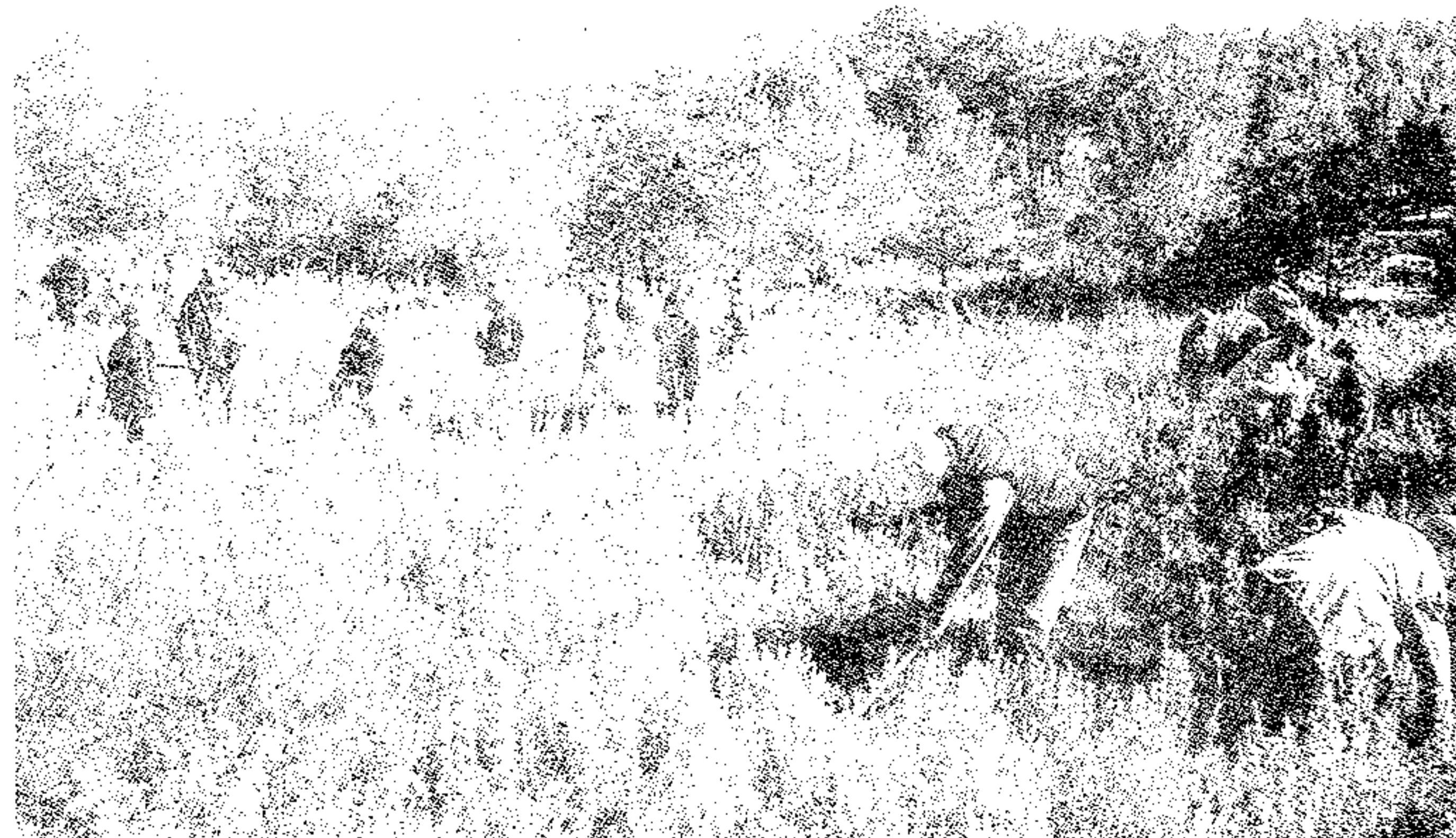
Participantes en el Día del Arbol

A continuación se le celebró la tradicional comida de hermandad entre