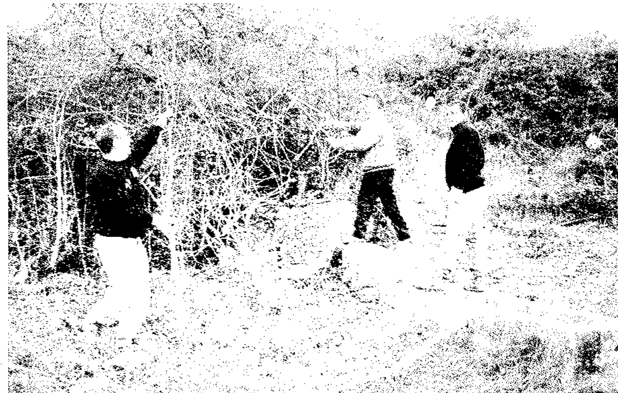
Pozo de Benamil