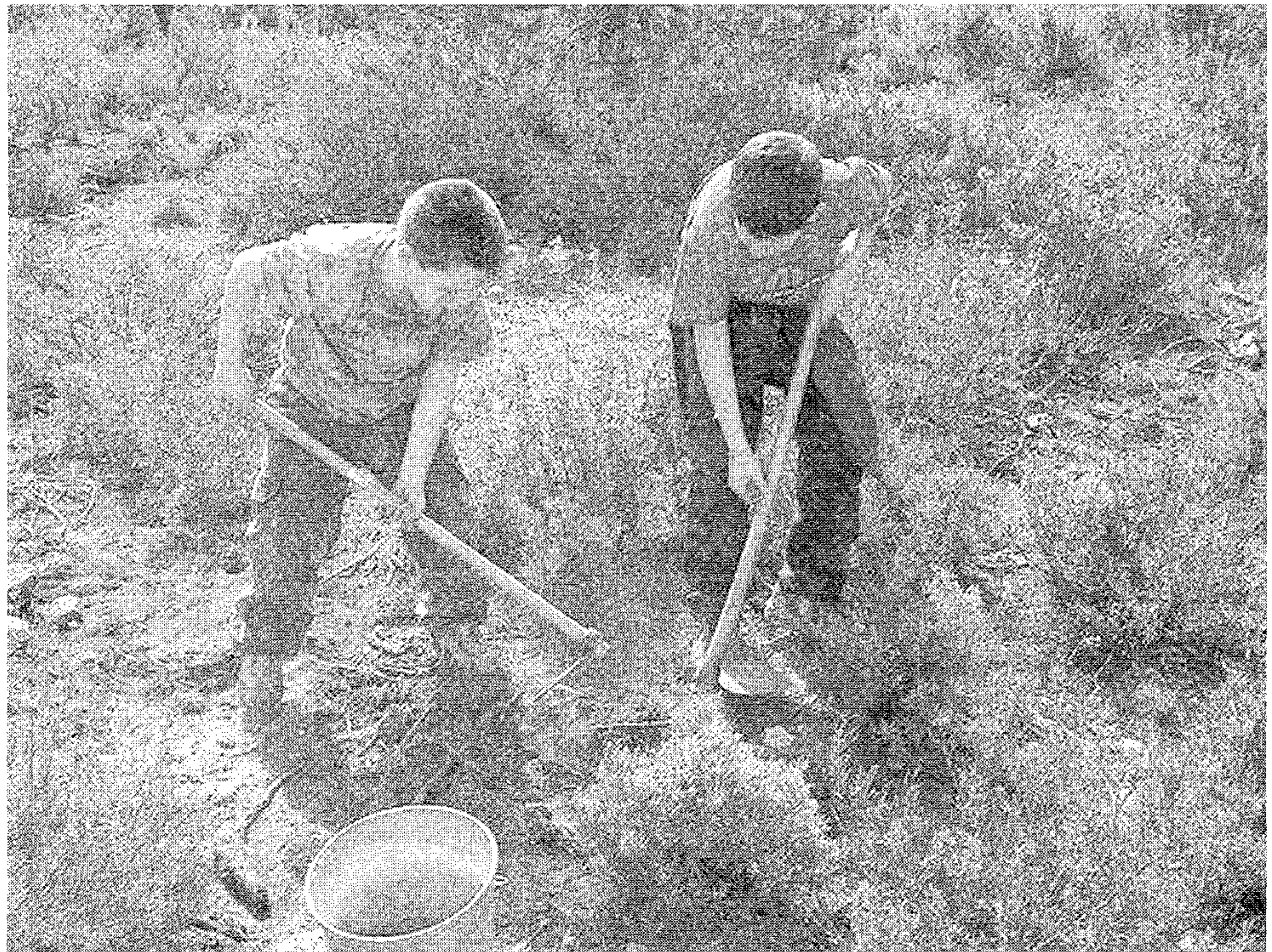
Jóvenes participantes en el «Día del Árbol»

El domingo día 2 de Abril, la Asociación para la Defensa de la Naturaleza de Enguera, ADENE , celebró por decimosegundo año consecutivo el "DIA DEL ARBOL", donde participaron entre los socios y simpatizantes más de doscientos.