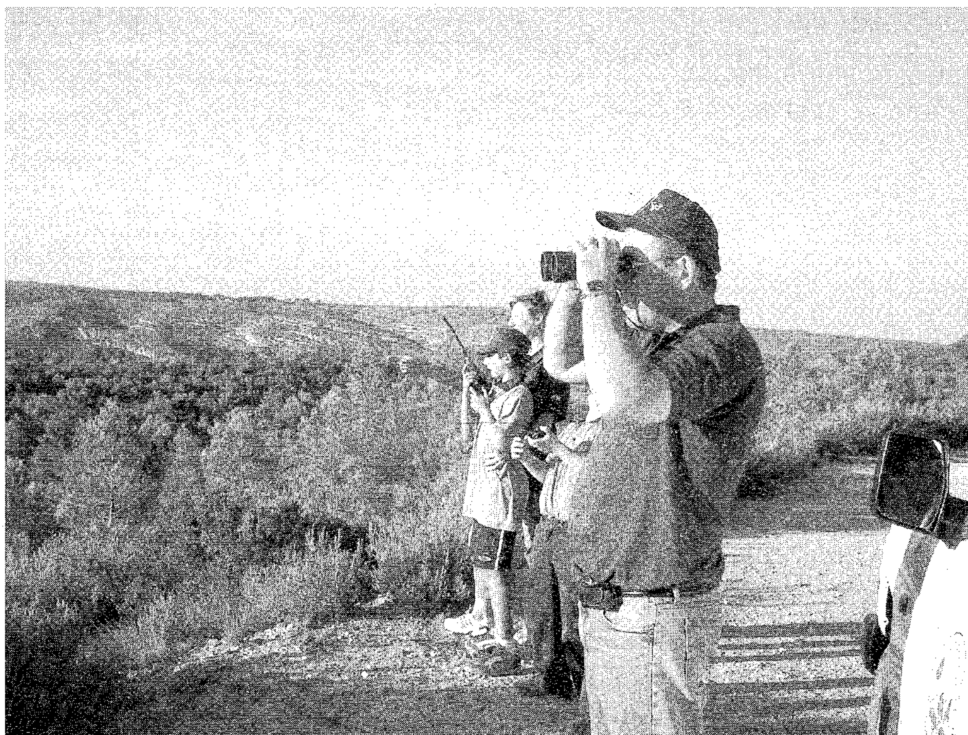
Vigilantes en la zona del Tejarico

Desde el día 1 de Junio y hasta el día 16 de Septiembre, el Grupo de Vigilancia Forestal de la Asociación para la Defensa de la Naturaleza de Enguera, ADENE, puso en marcha el dispositivo de Vigilancia y control en la Sierra de Enguera, en lo referente a la prevención de Incendios Forestales.