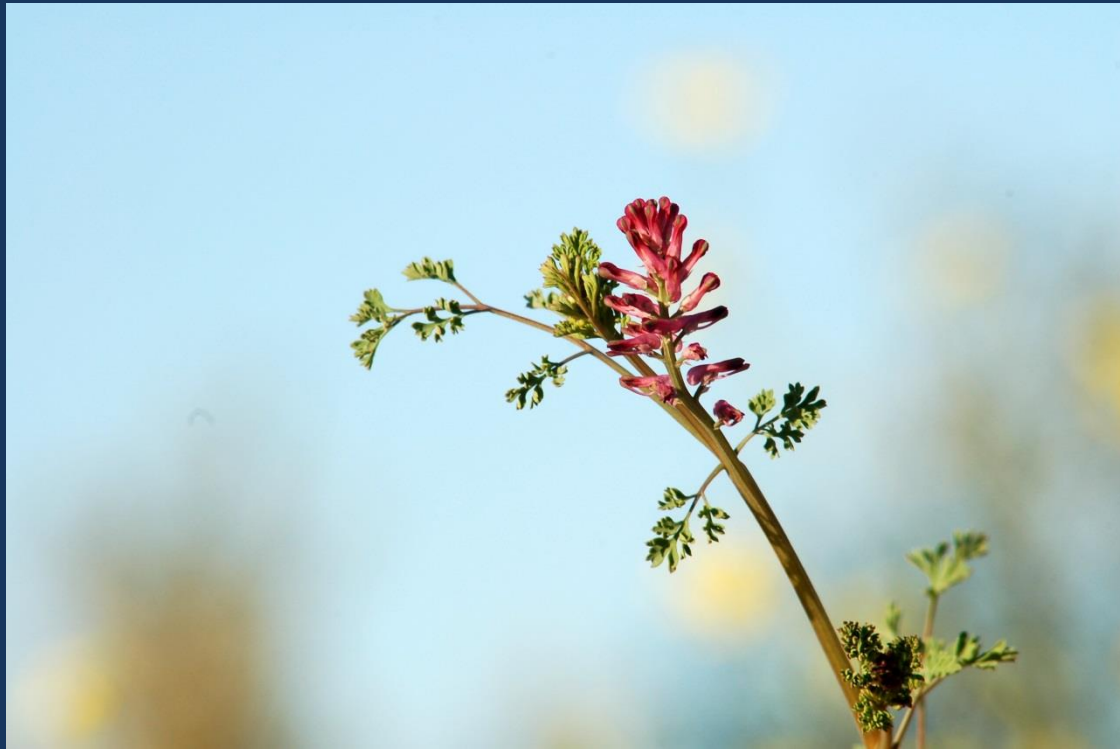
Tallo y flor