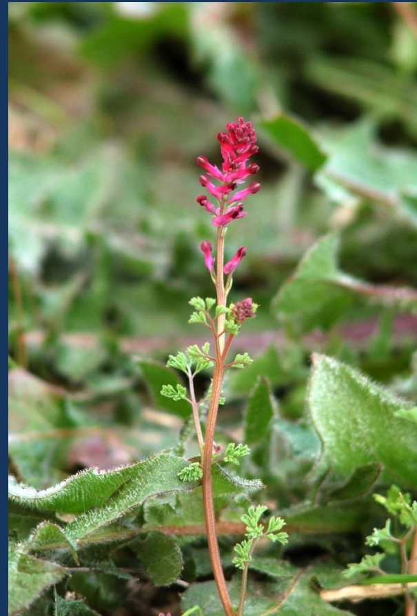
Tallo y flor