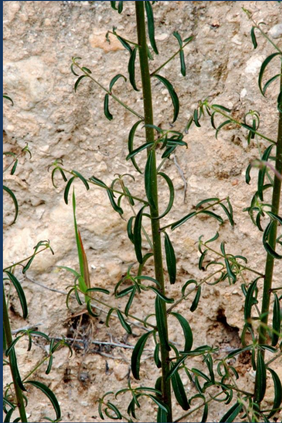
Tallo y hojas