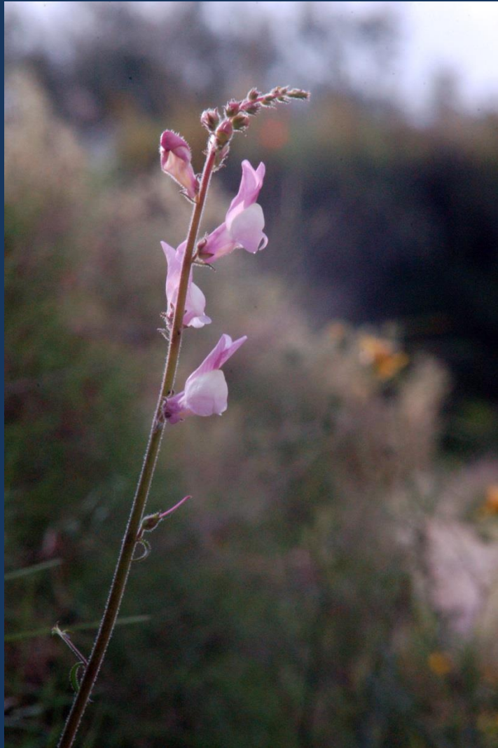
Tallo y flores