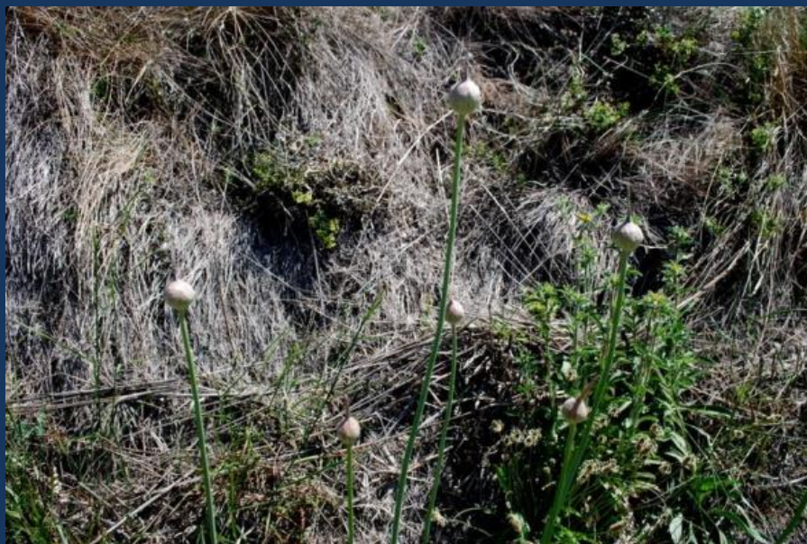
Inflorescencia con membrana