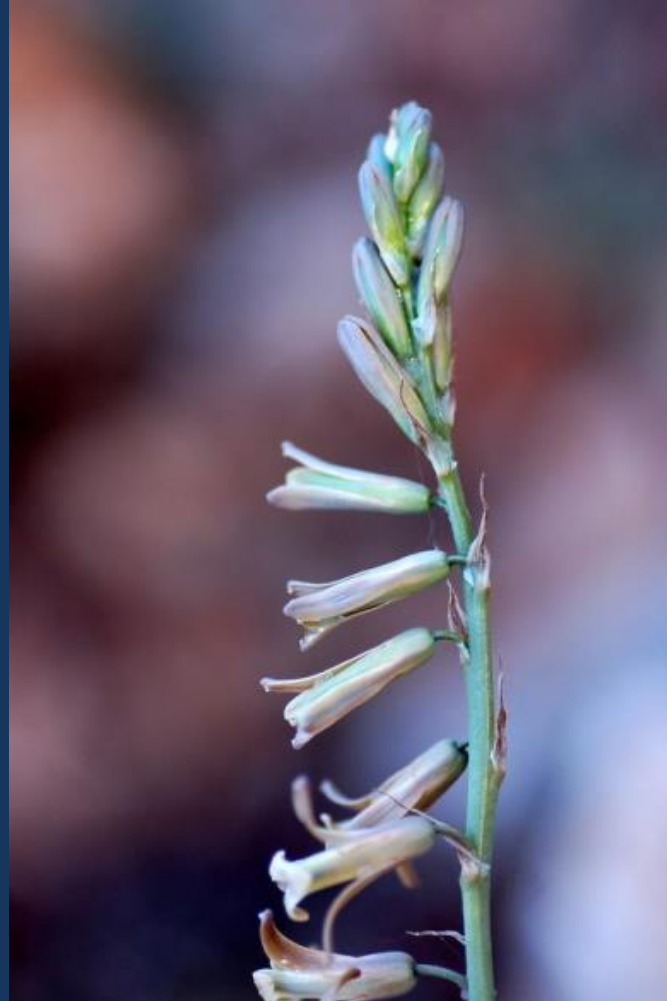
Tallo y flores