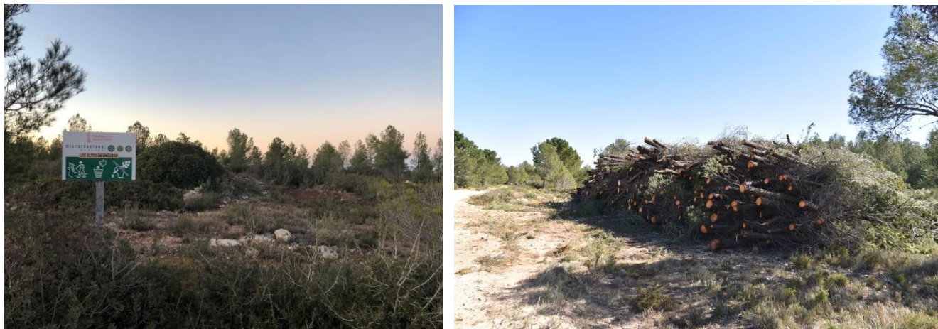
Pila de árboles depositados en parte de la microrreserva.

En términos generales la extracción debe ser beneficiosa para nuestros montes y agradecemos el esfuerzo por realizar un buen trabajo. Pero habida cuenta del impacto visual y físico que provoca este tipo de gestión debemos ser cuidadosos en su ejecución y cumplir con los requisitos pactados, así como con la legislación vigente.