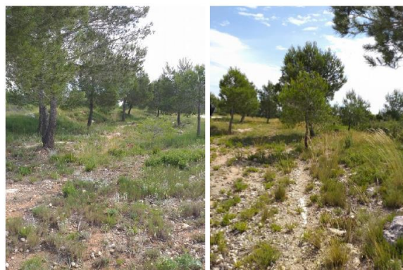
Vistas de la microrreserva en las que se observa el matorral aclarado con presencia dispersa de pino carrasco ( Pinus halepensis ), lugar donde crece el endemismo Sideritis sericea .