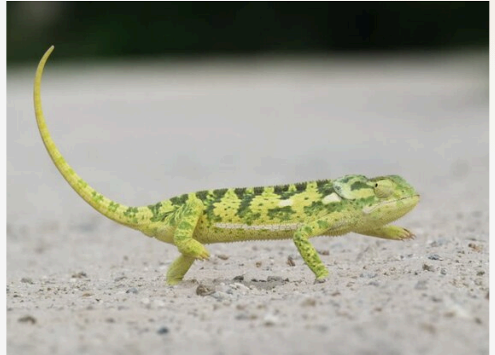
Salamanguesa Común (Tarentola mauritanica)

SABÍAS QUE... Su piel es hidrófoba (repele el agua) y se mantiene siempre limpia, lo que les ayuda a no perder adherencia.